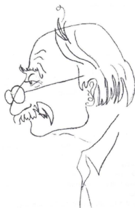
Рис. 2. Обложка программы конференции, посвященной памяти З.И. Боровича

В заключение скажу еще, что 17–23 сентября 2002 года в СПбГУ прошла Международная Алгебраическая Конференция, посвященная памяти Зенона Ивановича Боровича (обложку программы см. на рис. 2) на которой, кроме пленарных докладов российских профессоров: А.В. Яковлева, С.В. Востокова, Н.А. Вавилова, А.А. Махнёва, С.И. Адяна, были представлены доклады и сообщения гостей из Италии, Голландии, Германии, Китая, Сербии, Латвии и других стран, а также молодых математиков из России.