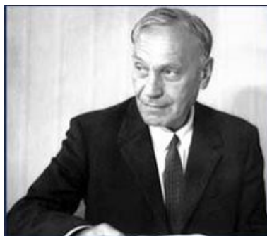
Александр Лейпунский в Обнинске

водит вне Киева, являясь с 16 ноября 1945 года первым деканом и заведующим кафедрой прикладной ядерной физики в созданном постановлением Совета народных комиссаров СССР 12 Инженерно-физическом факультете Московского механического института 13 и одновременно с 1945 года заместителем начальника 9-го (атомного) Управления МВД, организуя деятельность им же отобранных немецких физиков и инженеров в специнститутах в Сухуми и Обнинске и направляя их работу в Атомном проекте СССР [6, с. 11, 131]. В 1949 году возглавил в Обнинске отдел Физико-энергетического института, а с 1950 года — научный руководитель создания ядерных реакторов на быстрых нейтронах.